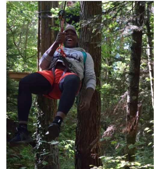
Parcours aventure en forêt