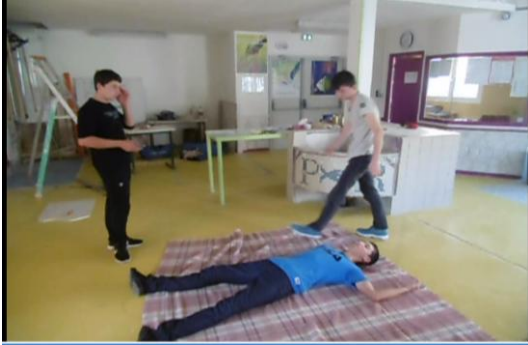
Santé, Sécurité au Travail : validation des brevets SST et PRAP

Témoignages, échanges, avec les représentants d'associations : Don du sang, France adot63 pour le don d'organes, Liber Addict, Planning familial, Sécurité à la T2C, EGEE.