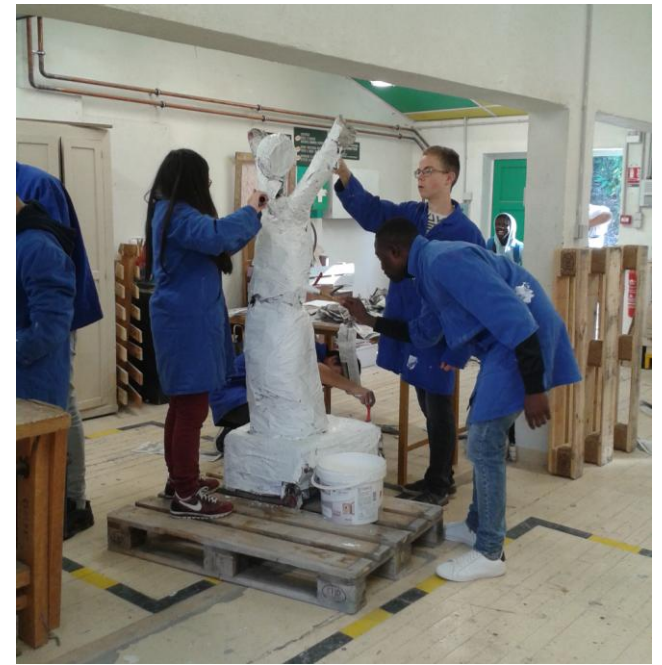
Installation artistique collaborative sur les traces de Fernand Léger